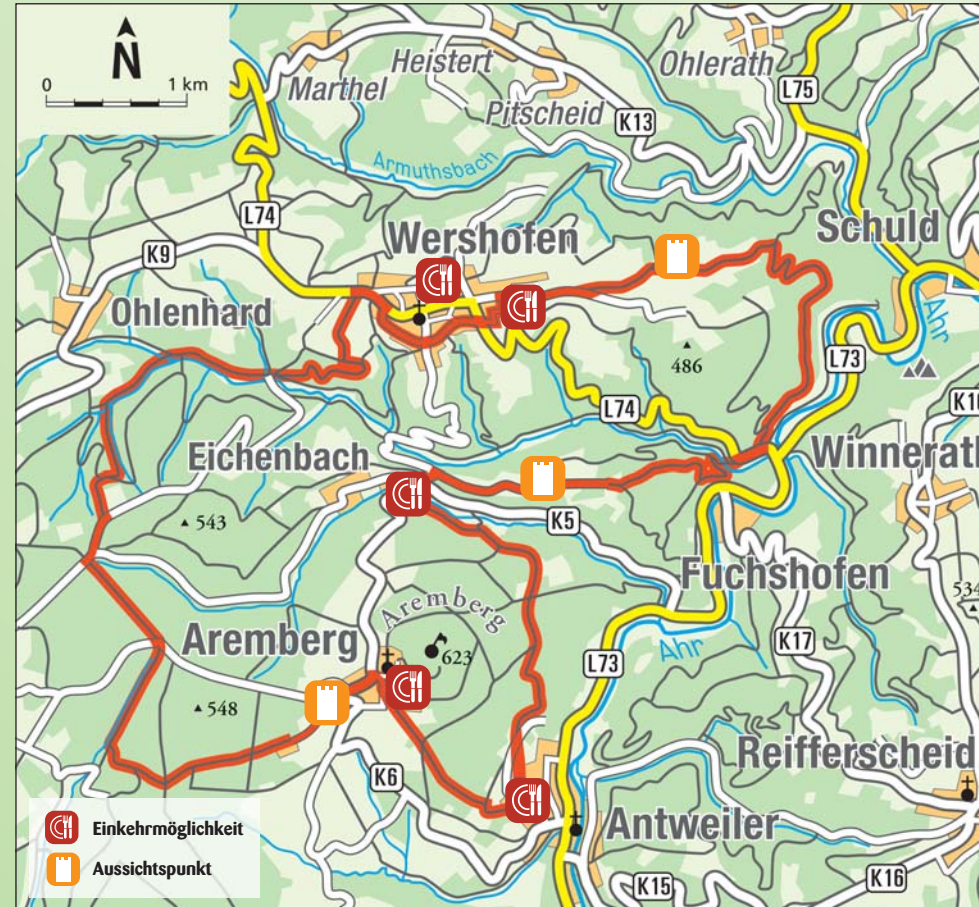
Die Route ist durchgängig ausgeschildert.

Länge der Wegabschnitte: Aremberg – Antweiler: 3,0 km, Antweiler – Eichenbach: 4,3 km Eichenbach – Wershofen: 10,5 km, Wershofen – Aremberg: 10,1 km