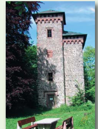
Turm Schlossruine Aremberg